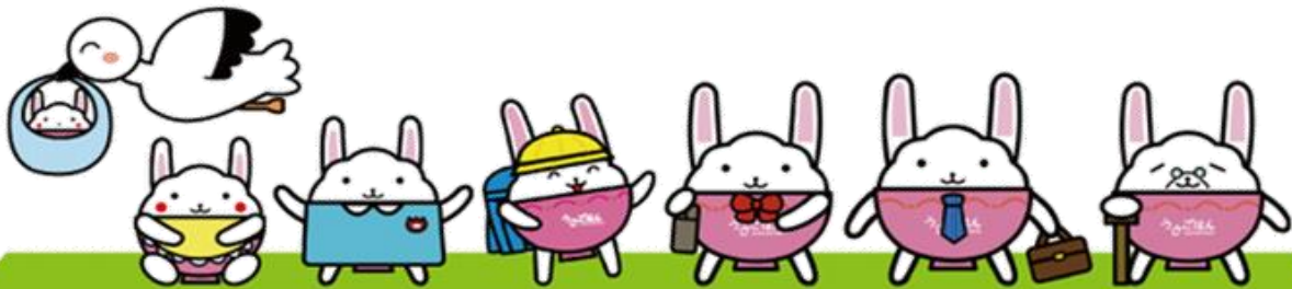
中野区食育 マスコットキャラクターうさごはん

北部すこやか福祉センターの栄養士さんから、災害時に役立つ食事のヒントやレシピ紹介、常備しておくの良いものなどのお話を聞くことができます！ 離乳食の進め方や、食に関してなど個別のご相談にも対応していただけます。 当日は試食があります。受付の際にアレルギーの有無を確認させていただきます。