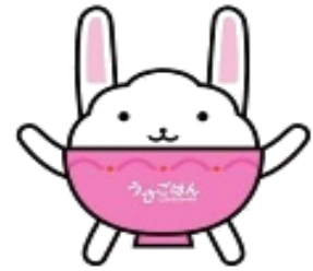
中野区食育マスコットキャラクター うさごはん